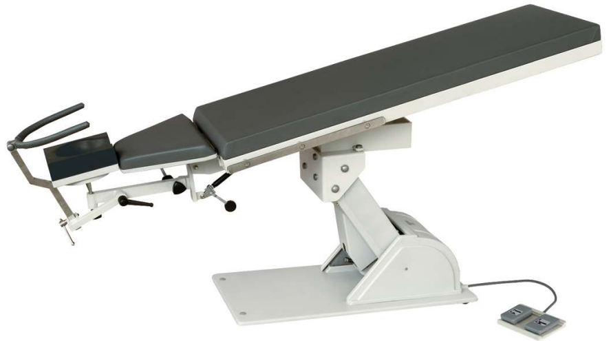
Table Height : 520mm - 880 mm Table Length : 2200mm Table Width : 550mm Table Base : 500mm x 980mm Head Section : 215mm x 235mm Shoulder Section: 480mm x 330mm Bed Section : 550mm x 1500 mm Lifting Capacity : 150 kg Motor : 2 Pieces Command Module : Foot switch