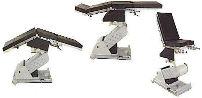
Table Height : 740mm - 1040 mm Table Length : 2040mm Table Width : 500mm Table Base : 500mm x 1000mm Head Section : 500mm x 295mm Back Section : 500mm x 600mm Seat Section : 500mm x 460 mm Leg Section : 240mm x 665mm Motor : 3 pieces Lifting Capacity: 150 kg Command Module : Foot switch